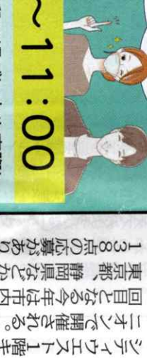
園の生徒が新メニューを楽しんだ画した。