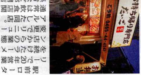
園の生徒が新メニューを楽しんだ画した。