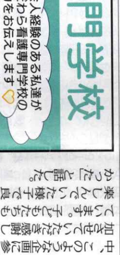
園の生徒が新メニューを楽しんだ画した。