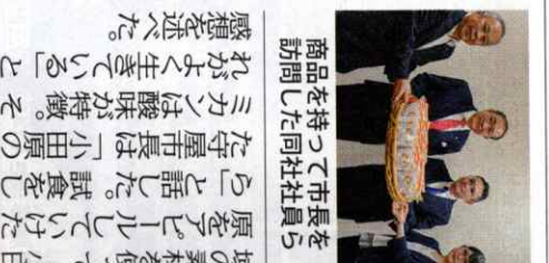
市長を 持った同社社員ら 品を持った同社社員ら 訪問した同社社員ら