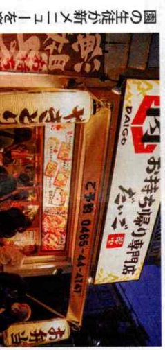
園の生徒が新メニューを楽しんだ画した。